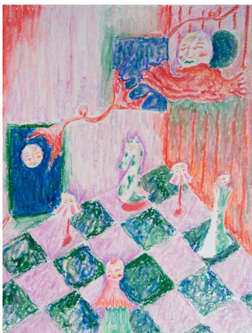
Viki Mladenovski Antipositional, 2022 Huile, pastel, et crayon de couleur 23,8 x 30,5 cm