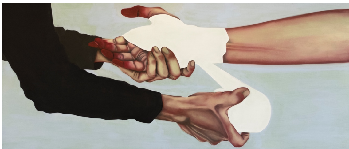
Julie Wagener This is just the beginning I, 2023 Huile sur panneau en bois 120 x 50 cm

Dans son travail, Julie Wagener s'intéresse à la construction du Selbst-Verständnis de l'individu du 21e siècle : la contextualisation de l'existence, la fabrication d'identité et l'appropriation de sens. Dans ce contexte, ce sont la solitude, les sentiments de détresse, d'abandon et d'aliénation de l'individu face à notre société qui sont au centre de la peinture de l'artiste.